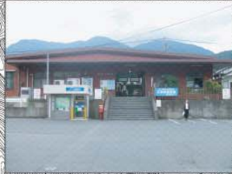
JR安芸中野駅（駅前広場）